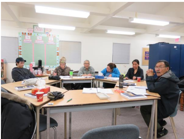
CFSC-nik Ayuiqhaniq Hanirayakmi

CFSC-guyug Ihuaqhaqhimayut ikayuqtiqaqtunik avikuqhimayunit ukiuqtaqtumilu, kanatamilu timiuyunit ihumagiyaqaqtunik hiquutit aaniqnaiganik, amihulu hiquutinik angunahuaqtilu ilihautikhanik ilihaiyinit humiliqaa Kanatamit. Hunaqaqniqit uuma ilihautikhap munariyayug agiqtauvakhunilu Piliihimanit Kanatamiutat Hiquutiliqinikut Havaaganit